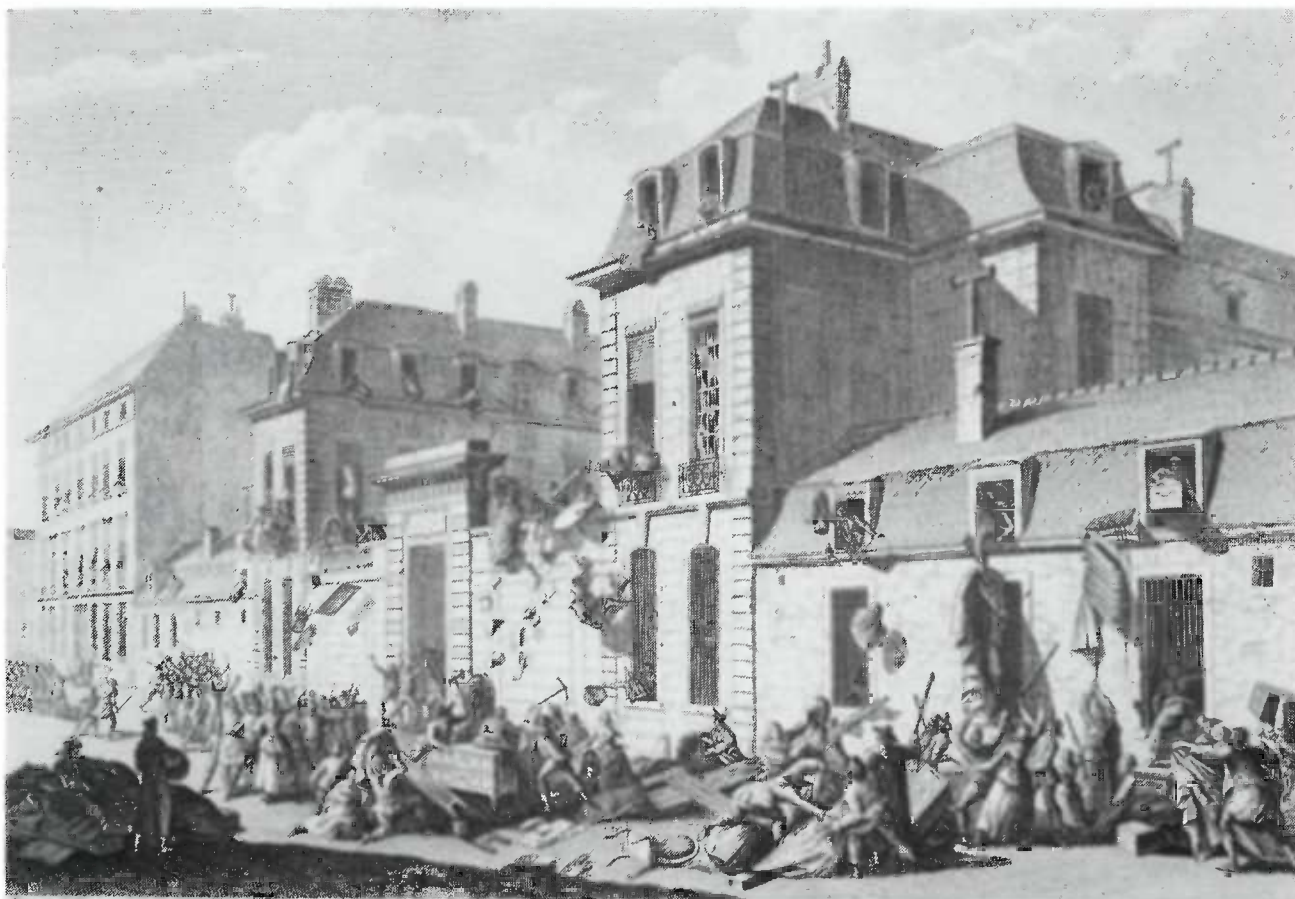
PILLAGE DE L'HOTEL DE CASTRIES, F.B.C. ST. GERMAIN A PARIS.