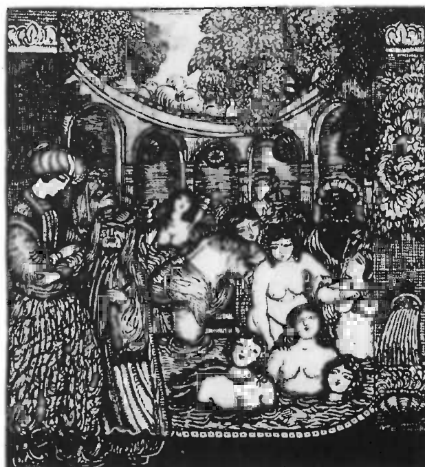
Illustration from: Appollon . Spb., 1909-1917.

With this catalogue IDC makes an important addition – no less than 104 titles – to the already magnificent collection of 951 titles, listed in the 1977 catalogue. This increase was made possible by access to the rich Slavic collections of the Czechoslovakian National Library in Prague and the Austrian National Library in Vienna. The newly added titles are listed separately at the beginning of this catalogue for the convenience of librarians whose institution already has the initial collection. The second part of the catalogue gives a listing of the entire collection of 1,055 titles in alphabetical order.