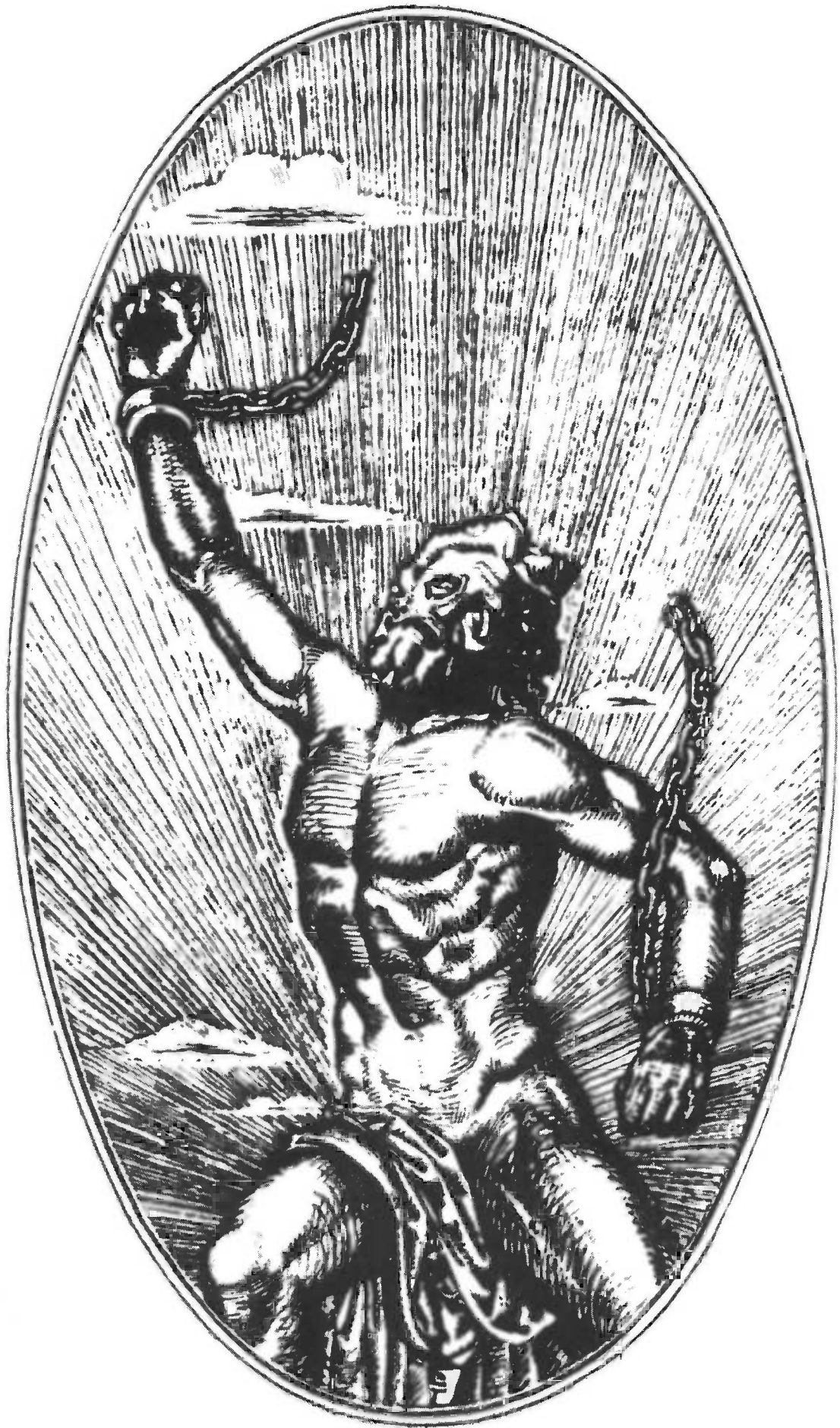
Illustration from: BRIUSOV, V. Stikhi. M., 1972.