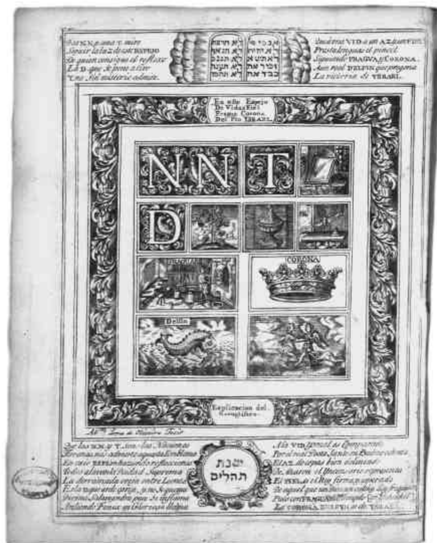
Illustration from: Abraham Pharar. Declaracão das 613. encomendanças de nossa sancta ley. Amsterdam: 5387 [1627].